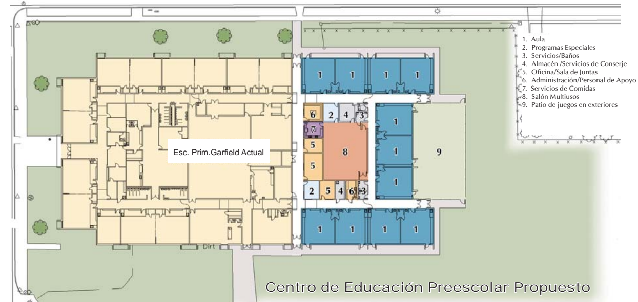
Centro de Educación Preescolar Propuesto